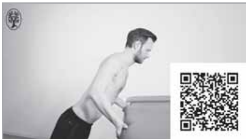
Film 4.5. Test pompki.

Pacjent wykonuje podpór przodem. W pozycji wyjściowej łokcie zgięte do 90°, przedramiona odwrócone, ramiona odwiedzone.